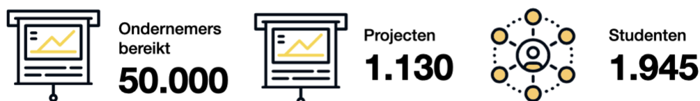
Figuur 2: bereikcijfers MKB Digital Workspace

Sinds eind 2019 zijn er mooie resultaten geboekt. Hieronder een aantal kengetallen over het bereik: