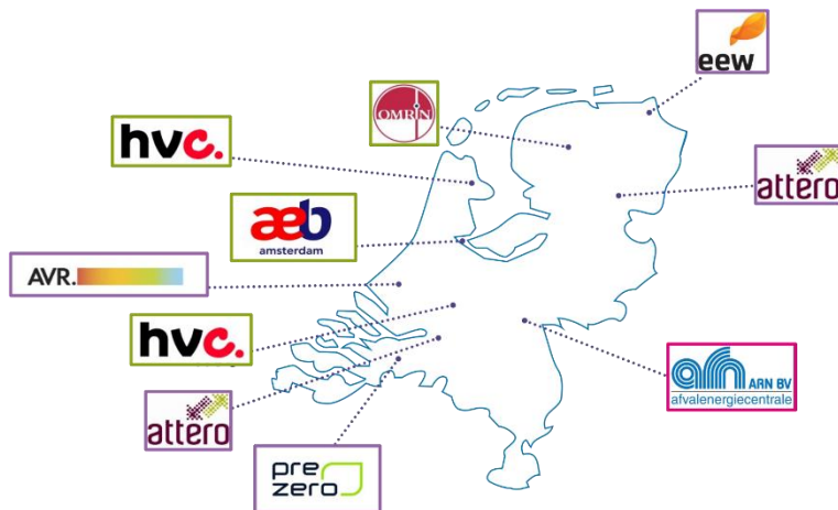
Figuur 1: Nascheidingsinstallaties in Nederland

Daarnaast zijn diverse partijen bezig met het uitwerken van plannen en business cases om te komen tot nascheiding of hun nascheidingsinstallatie uit te breiden. Het gaat hierbij om: EEW Delfzijl, PreZero Roosendaal, Attero Moerdijk, HVC Dordrecht, ARN Weurt en de uitbreiding van nascheidingsinstallaties van Attero Wijster en Omrin Heerenveen.