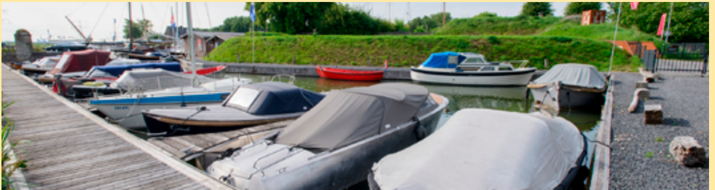
Binnenwater Fort H, Muiden