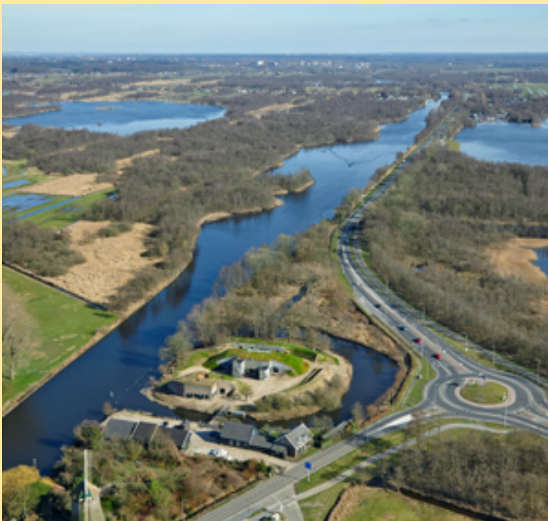
Fort Kijkuit, Wijdemeren