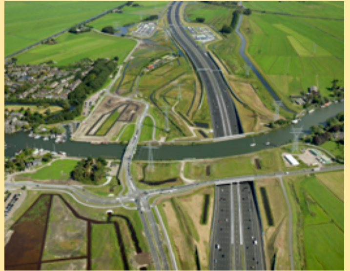
Landschapsherstel bij de A1, Muiden