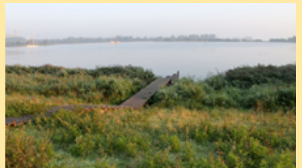
Natuurboulevard langs het IJmeer