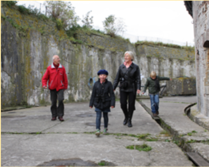
Forteiland Pampus, Muiden