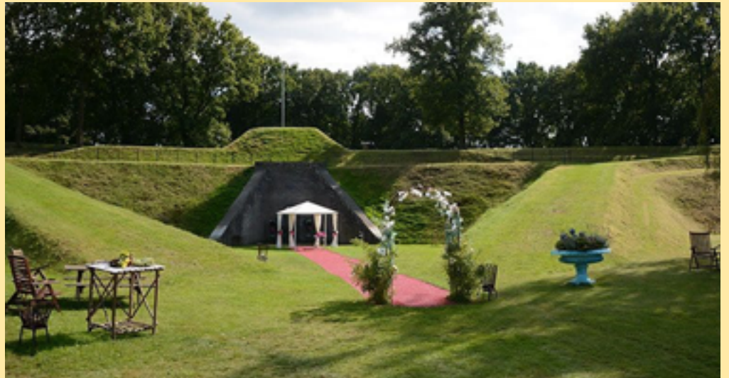
Fort Werk IV, Bussum