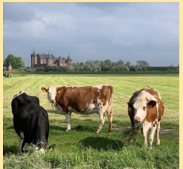
Grazende koeien voor het Muiderslot