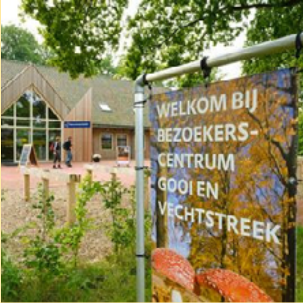
Bezoekerscentrum Natuurmonumenten Gooi en Vechtstreek