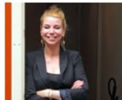
Zorgcoördinator Volle aandacht voor slachtoffers Passende hulp organiseren Regie voeren