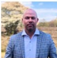
Ketenregisseur Samenwerking in de keten / Sluitende aanpak Randvoorwaarden creëren Controle en handhaving