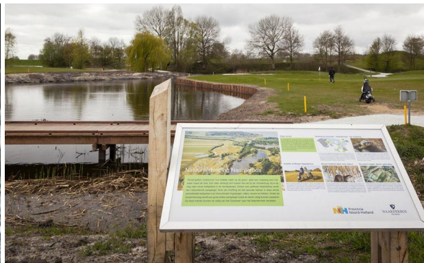
De ecologische verbinding en de passage over de golfbaan.