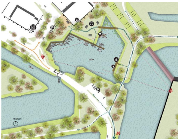
Afbeelding uit concept visie passantenhaven met de herstelde vestinggracht.

Het beschikbare budget is niet genoeg om alle overgebleven projecten uit te voeren. Daarom is ervoor gekozen dit eerst in te zetten voor het herstellen van de vestinggracht bij Naarden. Uit de participatie bleek dat veel mensen hier enthousiast over zijn. Dit project dient ook meerdere doelen. Het is ook een verfraaiing van de entree van de vesting en creëert de mogelijkheid om ligplaatsen te maken. Met de sloop van Energiestraat 1 is de ruimte voor de havenkom al vrijgespeeld. Over het type haven, passanten- of vaste ligplaatsen, wordt nog besloten.