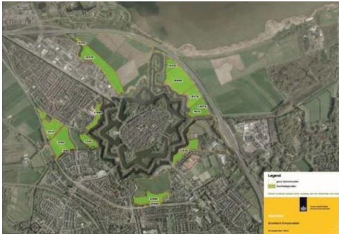
De overheidsgronden in het schootsveld

De gronden waren van de gemeente Gooise Meren. De gemeente heeft een subsidie gehad als vergoeding voor de opbrengst van de gronden. De gemeente steekt dit weer in het programma, en in het bijzonder in de aankoop en sloop van Energiestraat 1. Zo wordt met één subsidie zowel het schootsveld veiliggesteld als een stuk openheid hersteld.