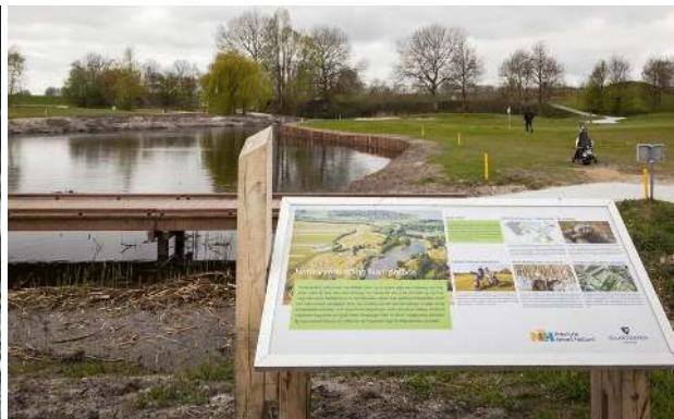
De ecologische verbinding en de passage over de golfbaan.