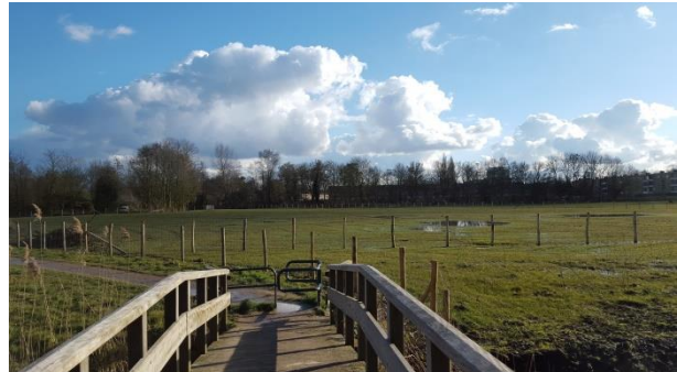
Herstelde openheid in het schootsveld