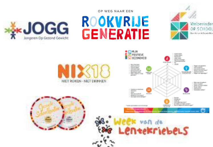
Keuze voor combinatie van activiteiten (leerlingen, leerkrachten, ouders)