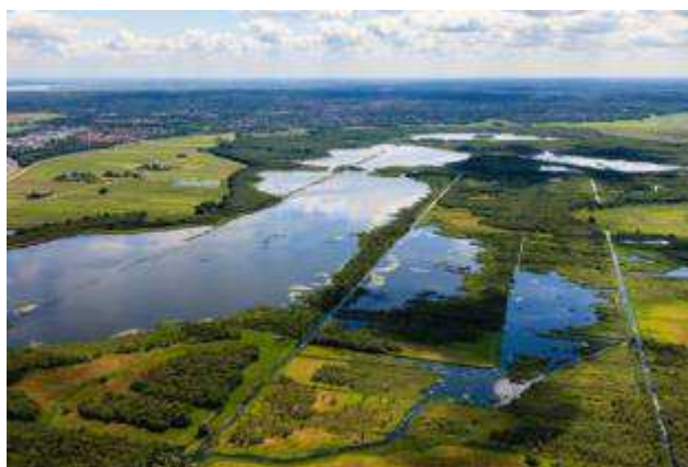
Het Naardermeer (zicht op Naarden en Bussum)