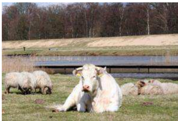
Zanderij Crailo tussen Hilversum en Bussum

Het landschapsbeeld is een feitelijk rapport, waarin het landschap van Gooi en Vechtstreek objectief staat beschreven en wordt gewaardeerd. De informatie komt uit diverse rapporten, onderzoeken en visies. Het landschapsbeeld geeft een overzicht van de relevante historische ontwikkelingen in het landschap, beschrijft het huidige landschap en hoe dit kan worden gewaardeerd. In de nog te realiseren landschapsvisie worden de keuzes uitgewerkt voor de toekomst van het landschap.